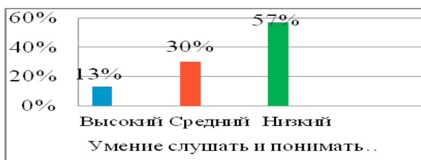
Рисунок 3 - Результаты сформированности умения слушать и понимать речь других на уроках русского языка

Результаты анализа уровня сформированности речевой коммуникации на уроках русского языка показали, что на высоком уровне находятся 13% учащихся, на среднем уровне находятся 30% учащихся, на низком уровне находятся 57% учащихся.