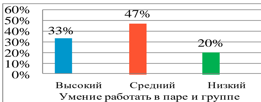
Рисунок 2 - Результаты сформированности умение работать в паре и группе

Результаты анализа уровня сформированности речевой коммуникации на уроках русского языка показали, что на высоком уровне находятся 33% учащихся, на среднем уровне находятся 47% учащихся, на низком уровне находятся 20% учащихся.