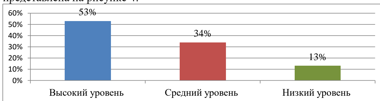
Рисунок 4 - Средний показатель результатов сформированности коммуникативных УУД у младших школьников

Общая характеристика критериев сформированности коммуникативных УУД у младших школьников на уроках математики представлена на рисунке 4: