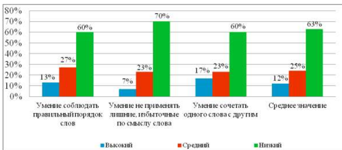
Рисунок 1 – Результаты среднего значения сформированности умения логично выражать свою речь

Из диаграммы видно, что 12% учеников находятся на высоком уровне сформированности умения логично выражать свою речь, они соблюдают правильный порядок слов, не применяют лишние, избыточные по смыслу слова, умеют правильно сочетать одни слова с другими. 25% учащихся имеют средний уровень сформированности умения логично выражать свою речь, такие ученики не всегда соблюдают правильный порядок слов, не всегда правильно сочетают слова друг с другом и не всегда умеют правильно сочетать одни слова с другими. И 63% учеников находятся на низком уровне. Эти ученики не умеют соблюдать правильный порядок слов, применяют лишние, избыточные по смыслу слова, не умеют сочетать одни слова с другими.